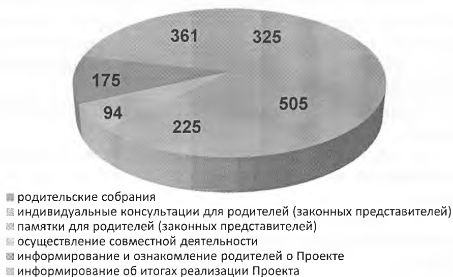
Рис. 1. Количество родителей (законных представителей), принявших участие в различных формах информационно-просветительской работы

В МБОУ ЦО №№ 9, 31, МБОУ «ЦО № 58 “Поколение будущего”», МБОУ «ЦО- гимназия № 30», МБОУ «ЦО-гимназия № 1», МБУДО ЦРР № 6 в период с января по март 2022 года для родителей (законных представителей) подготовлены презентации, фото и видеоматериалы по реализации проекта «Современные дети», проведены открытые показы «Мир английских слов», «Мы в мире информатики», «Мы играем в шахматы» и др. (охвачено – 361 родителей (законных представителей)).