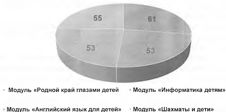
Рис. 2. Количество педагогов, реализующих дополнительную общеобразовательную программу по социально-коммуникативному и познавательному развитию «Современные дети»

- модуль «Шахматы и дети» реализуют 55 педагогов (уменьшение на 2 педагога).